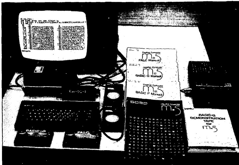
Obr. 2. Celková sestava počítače

Tvorbu programů usnadňují příkazy AUTO (automatické řádkování), RENUM (přečíslování řádek programu) a DEL (vymazání řádek programu). Pro odlaďování programů je velice užitečný příkaz TRACE ON/OFF, který způsobí výpis čísel jednotlivých prováděných řádků na obrazovku nebo tiskárnu. Chybová hlášení jsou kromě výpisu na obrazovku ještě ukládána do paměti, odkud je lze vyvolat příkazy ERR (kód chyby) a ERRL (číslo řádku s chybou). Lze použít příkaz ON ERROR GOSUB a ON EVENT GOSUB - první z nich převede program na podprogram